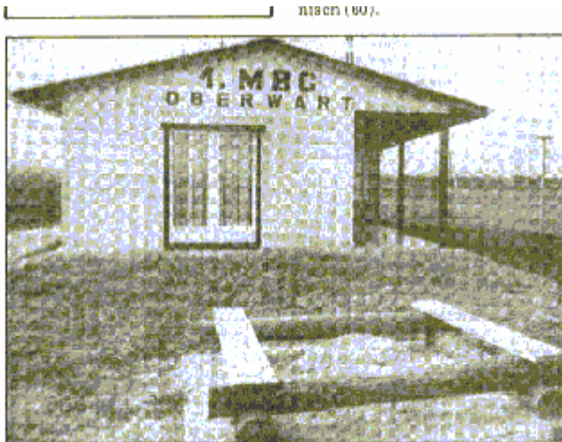
Oberwart: Neues Clubhaus

26.06.1983 Großflugtag anlässlich der feierlichen Eröffnung des Clubhauses Nebst der Abhaltung des Flugtages fand auch ein Flohmarkt statt, bei welchem tolle Fluggeräte als auch sonstiges Equipment für den Modellflug angeboten wurden.